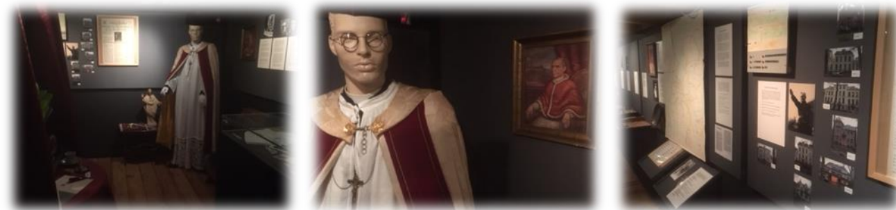
expositie Aartsbisschop tegenover aartsvijand